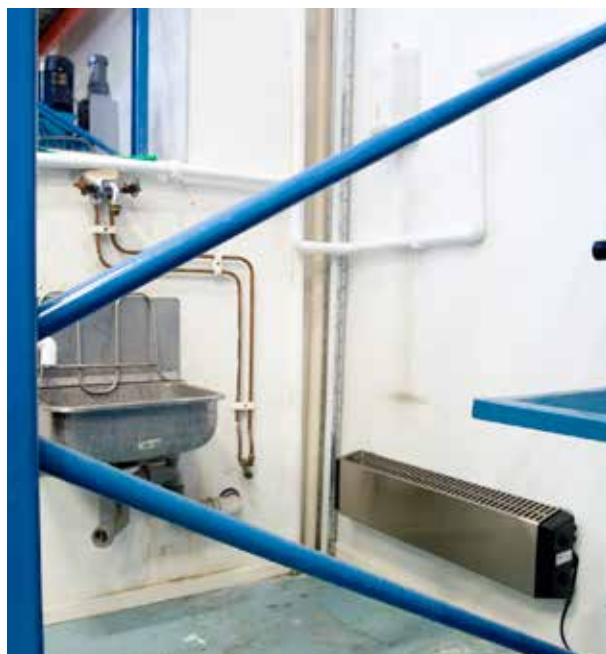
In het roestvrijstalen design is de Thermowarm bestand tegen corrosieve omgevingen.