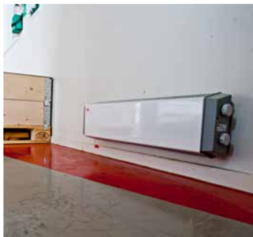
De Thermowarm is verkrijgbaar met een wit front, met of zonder een aan/uit schakelaar.