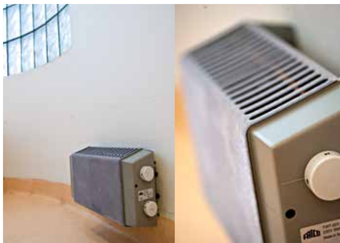
Het grijs bedekte frontpaneel zorgt voor een lage oppervlaktetemperatuur en de TWT200 wordt daarom aanbevolen voor bijv. badkamers.