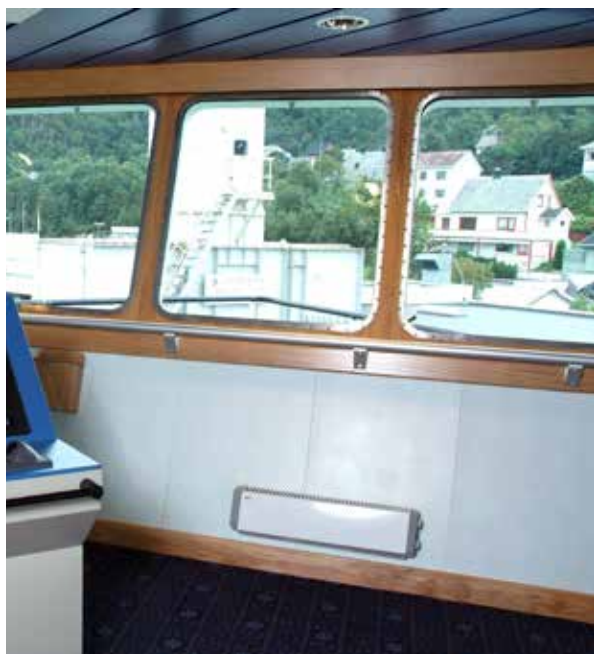
De kleine afmetingen en de makkelijke installatie maken de Thermowarm eenvoudig te plaatsen, zelfs in krappe ruimtes zoals een elektriciteitskast.